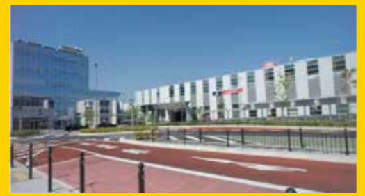
つくばエクスプレス万博記念公園駅