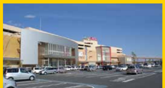
イオンモール土浦